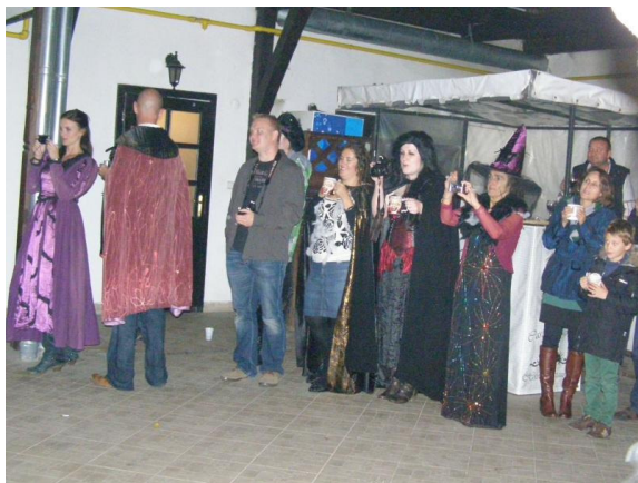
De la Dracula lui Bram Stoker la Vlad Țepeș